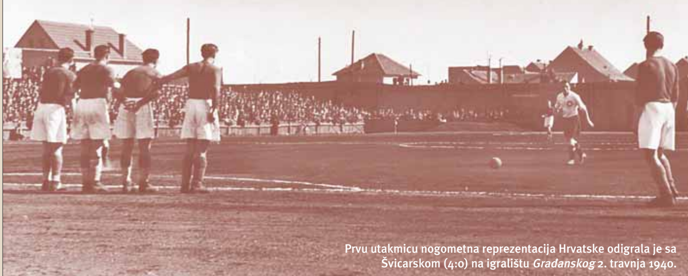
Prvu utakmicu nogometna reprezentacija Hrvatske odigrala je sa Švicarskom (4:0) na igralištu Gradanskog 2. travnja 1940.

ni napustiti skupštinu. Prvi pokušaj promjene stanja nije uspio, ali hrvatski nogometaši nisu odustali. Na konferenciji hrvatskih nogometnih podsaveza, 26. veljače 1939. godine, koju je sazvao Zagrebački nogometni savez, hrvatski su klubovi odlučili ustrajati u svojoj namjeri reorganizacije JNS-a. Donesena je odluka o istupanju hrvatskih klubova iz nacionalne lige u kojoj su tada bili zagrebački klubovi, Gradanski , HAŠK, HŠK Concordia i varaždinska SK Slavija . Nakon toga pokrenuta je akcija za osnivanje organizacije koja bi okupila sve hrvatske nogometne klubove i koja bi se još uspješnije mogla boriti za reorganizaciju JNS-a. Ta organizacija postala je Hrvatska športska sloga (HŠS), osnovana na skupštini 14. svibnja 1939. u Zagrebu. Na skupštini je bilo 217 delegata hrvatskih nogometnih klubova. Svi su ti klubovi postali članovi HŠS-e. Prvi predsjednik HŠS-e bio je dr. Ivo Kraljević. Iako je nastao kao nogometna organizacija, HŠS je nastojao okupiti i ostale sportske grane. Nakon osnivanja HŠS-e, hrvatski delegati više nisu sudjelovali u radu JNS-a, a hrvatski igrači više nisu željeli nastupati za državnu nogometnu reprezentaciju. Tako dolazi do potpunog odvajanja hrvatskog nogometa od JNS-a. Kao odgovor Beograda stižu drastične kazne igračima, suspenzije hrvatskim klubovima i na kraju brisanje hrvatskih ligaša, bivših klubova iz nacionalne lige i JNS-a.